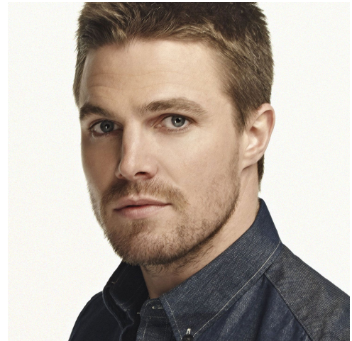
Oliver Jonas Queen